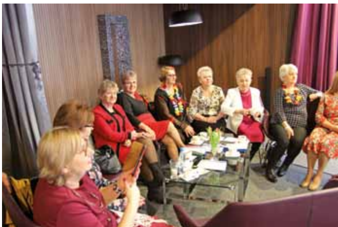
Fot. M. Maciejewski

Marcin Maciejewski Biuro Promocji Miasta Zambrów