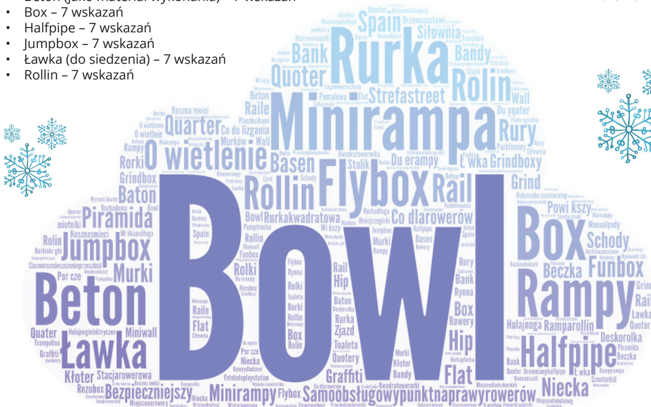
Grafika 1 Analiza frekwencyjności słów.