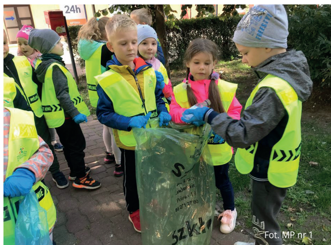
Fot. MP nr 1