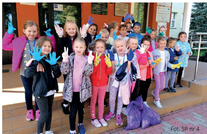
Fot. SP nr 4