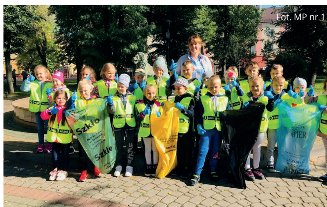
Fot. MP nr 1