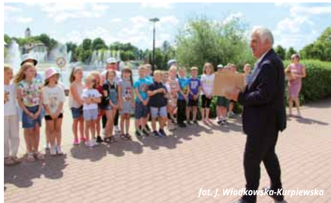
fol. J. Włodkowska-Kurpiewska