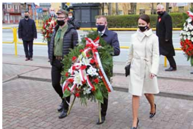
fol. J. Włodkowska-Kurpiewska