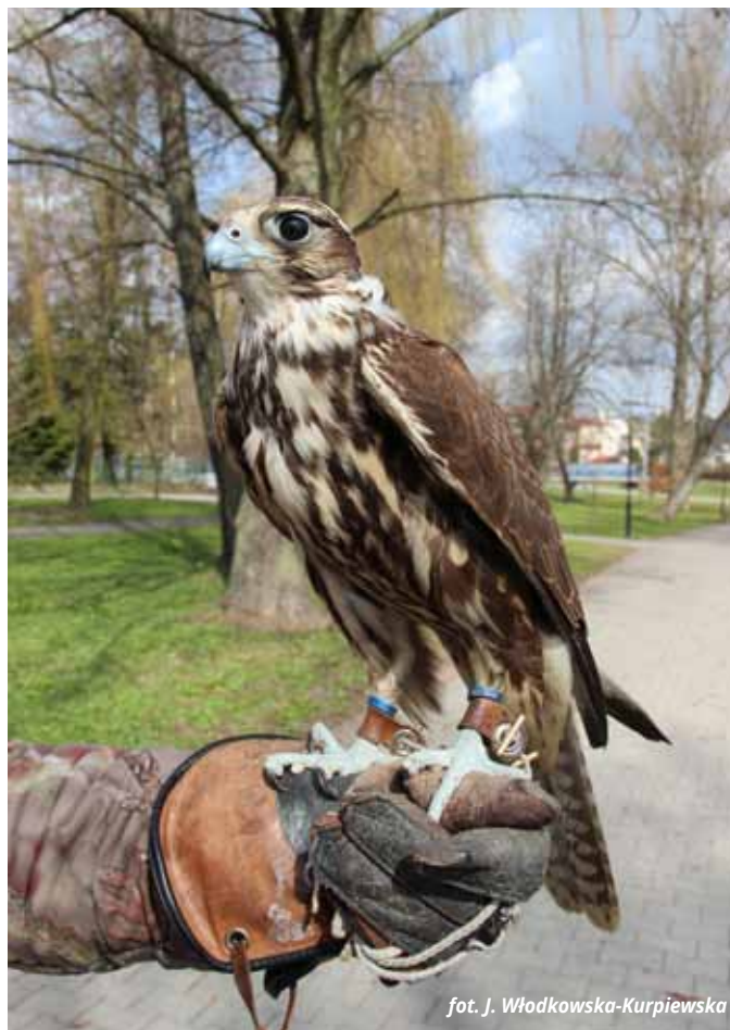
fol. J. Włodkowska-Kurpiewska

I. Kowalski: Metod jest kilka. Wspomnieliśmy już o hukowej, niestety nie sprawdziła się. Kolejna metoda to utrudnianie zakładania gniazd ptakom np. przez przycinanie atrakcyjnych gałęzi, co z kolei przekłada się na szpecenie drzew, bo nie zawsze można przyciąć te drzewo na tyle ładnie, aby gawron nie założył gniazda. Metoda sokolnicza jest najskuteczniejsza, co można było zauważyć dwa lata temu w Zambrowie. Elementem bocznym, aczkolwiek pozytywnym, jest fakt, iż jest to metoda atrakcyjna dla mieszkańców, niejednokrotnie zainteresowane dzieci podchodzą do mnie z pytaniem, czy mogą zrobić sobie zdjęcie z sokołem, którego na co dzień zapewne nie widują. A więc jesteśmy swojego rodzaju atrakcją w parku.