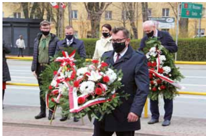
fol. J. Włodkowska-Kurpiewska