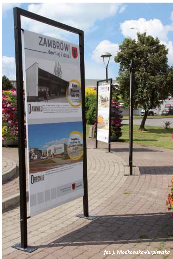
fol. J. Włodkowska-Kurpiewska