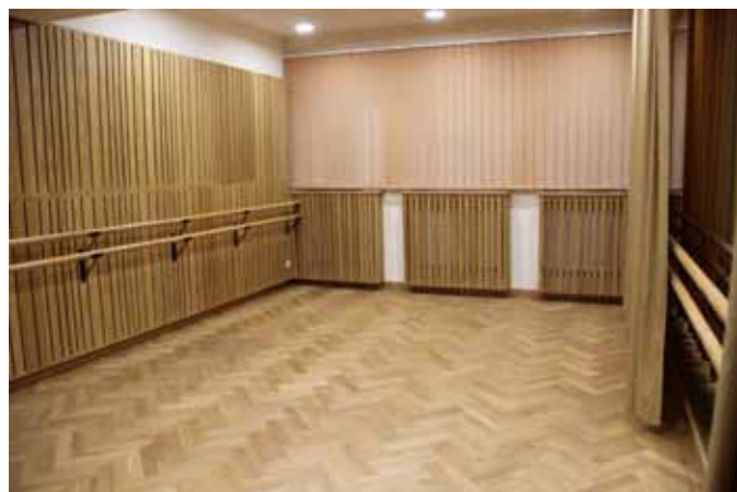
fol. J. Włodkowska-Kurpiewska