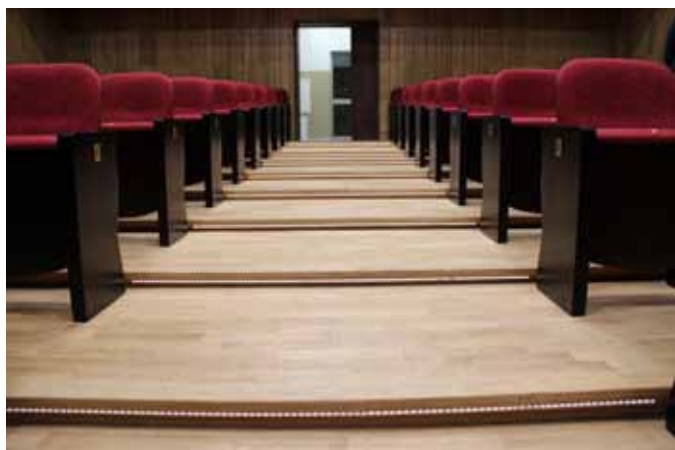
fol. J. Włodkowska-Kurpiewska

Całkowity koszt projektu to 7.517.996,80 zł, z czego koszty budowlane wyniosły 6.262.605,80 zł, zaś wyposażenie obiektu wyniosło 1.255.391,00 zł. Dofinansowanie z funduszy unijnych na budowę i wyposażenie obiektu wyniosło 85%, co stanowi 5.389.953,74 zł. Wkład własny ze strony Ministerstwa Kultury, Dziedzictwa Narodowego i Sportu wyniósł 2.128.043,06 zł. Sala została wybudowana w ramach środków finansowych Programu Operacyjnego Infrastruktura i Środowisko na lata 2014-2020 w ramach działania 8.1 Ochrona dziedzictwa kulturowego i rozwój zasobów kultury, Oś priorytetowa VIII Ochrona dziedzictwa kulturowego i rozwój zasobów kultury. Realizacja projektu