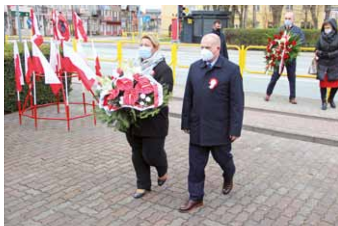
fol. J. Włodkowska-Kurpiewska