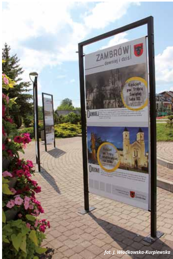
fol. J. Włodkowska-Kurpiewska