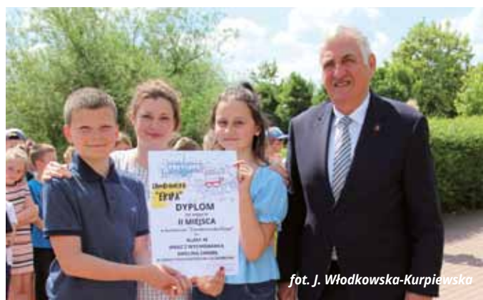
fol. J. Włodkowska-Kurpiewska