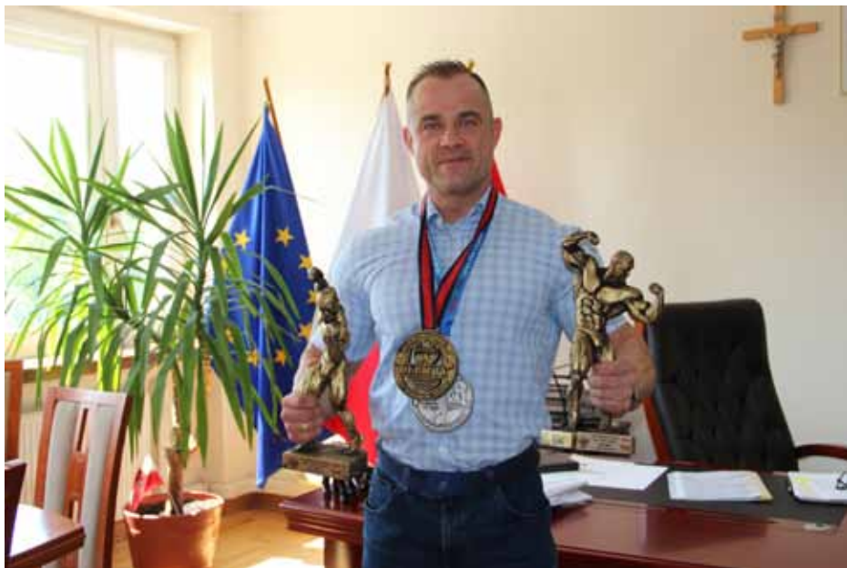
fol. K. Ilczuk

- Jak wygląda twój codzienny trening? Które ćwiczenia przychodzą z łatwością, a które sprawiają trudności?