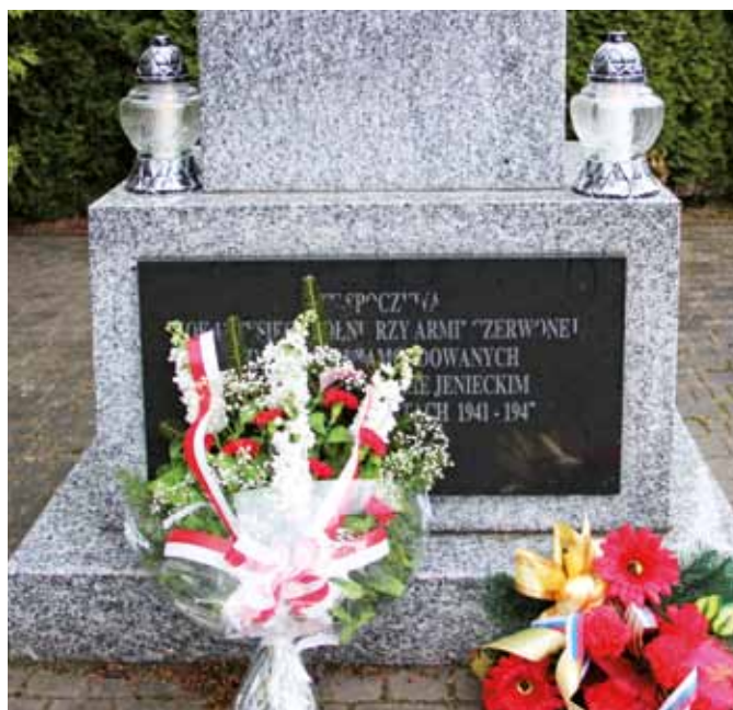
fol. J. Włodkowska-Kurpiewska