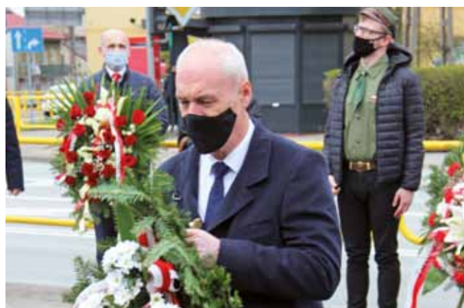
fol. J. Włodkowska-Kurpiewska